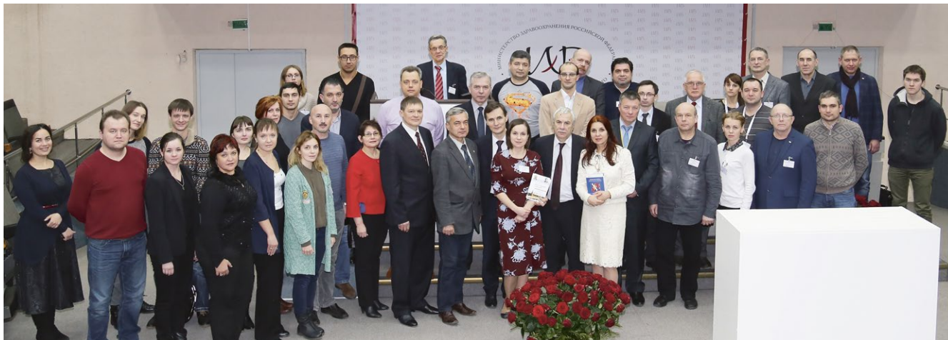
Рис. 4. Закрытие конгресса

Были предложены алгоритмы организации помощи раненым и пострадавшим, современные способы выполнения первичной хирургической обработки, местного лечения, иммобилизации поврежденного сегмента и т.д. В рамках конгресса прозвучали доклады о современных способах объективизации и контроля за течением раневого процесса и эффективности компьютерного мониторинга его динамики. Темами 2-х заседаний стали методы пластического закрытия обширных ран у детей и взрослых, где обсуждались как способы с использованием местных тканей и дозированного тканевого растяжения, так и микрохирургические техники перемещения комплексов тканей в зону дефекта. Докладчики не обошли вниманием и современные дополнительные физические методы лечения обширных ран: вакуумную терапию, гидрохирургию, ультразвуковую кавитацию — все они активно применяются как во взрослой, так и в детской общей и гнойной хирургии, травматологии, комбустиологии.