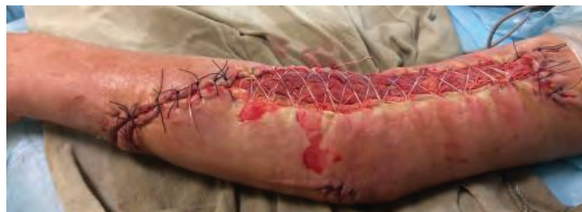
Рис. 11. Вид раны на одном из реконструктивных этапов лечения. Рана на 85 % укрыта полноценными местными тканями

При следующей смене вакуумной повязки произвели повторную хирургическую обработку раны, взяли материал для проведения микробиологических исследований, обработали рану пульсирующей струей жидкости, края раны повторно мобилизовали и сблизили, что позволило дополнительно уменьшить площадь раневой поверхности за счет местных тканей (рис. 11). Ложе раны укрыли атравматическим покрытием Atrauman® Ag. NPWT на этом этапе проводили с использованием стерильных одноразовых наборов VivanoMed® Foam Kit (L) в переменном режиме 90–135 мм рт. ст., аппаратом S 042 NPWT/VivanoTec® с санационными портами контролируемого орошения раны. Экспозиция вакуумной терапии на 3-м этапе лечения, учитывая снижение объема раневого отделяемого до 50,0 мл, работы дополнительных санационных портов, применение атравматического раневого покрытия Atrauman® Ag, составила 96 ч.