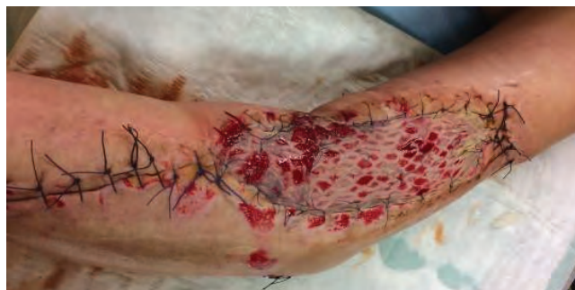
Рис. 15. Хорошая фиксация и приживление трансплантата в ране

Принято решение о продолжении вакуум-ассистированной терапии. При второй ревизии на 7-е сутки