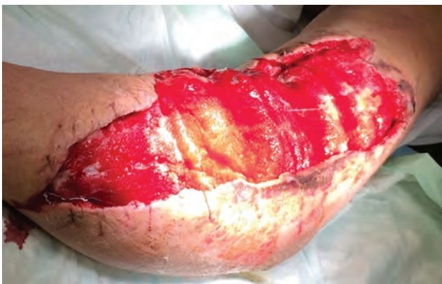
Рис. 5. Общий вид раны, 2-е сутки вакуум-терапии