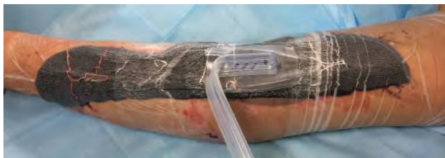
Рис. 14. Стабилизация трансплантата вакуумной повязкой VivanoMed® Foam Kit (L)

Следуя ранее выстроенному плану в условиях операционной под сочетанной анестезией, вакуумная повязка и адаптационные швы сняты, выполнена ревизия остаточной раны: рана соответствует критериям готовности к пластическому закрытию по С.Е. Attinger (2006). Выполнена подготовка раневого ложа, повторная хирургическая обработка раны и аутодермопластика расщепленным перфорированным кожным трансплантатом (рис. 12).