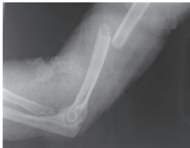
Рис. 1. Рентгенограмма левой плечевой кости при поступлении

Бригадой скорой медицинской помощи на месте ДТП выполнена остановка продолжающегося кровотечения, адекватное обезболивание и шинирование травмированного сегмента. Больной доставлен в приемное отделение травматологии по месту ДТП. При поступлении осмотрен дежурными специалистами, выполнено рентгенологическое исследование (рис. 1).