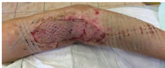
Рис. 16. Общий вид раны после снятия кожных швов

после аутодермопластики отмечена хорошая приживаемость трансплантата. Продолжено лечение атравматическими перевязочными материалами Atrauman® Ag и эластическая компрессия верхней конечности в амбулаторных условиях. Общий срок лечения составил 30 сут. Результат лечения расценен как хороший как в функциональном, так и в косметическом отношении. Вид раны после снятия кожных швов представлен на рис. 16.