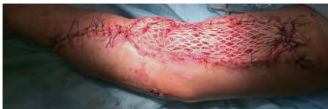
Рис. 12. Аутодермопластика остаточной раны левой верхней конечности расщепленным перфорированным трансплантатом