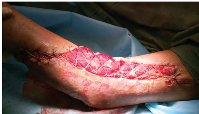
Рис. 10. Вид раны после снятия NPWT-повязки и частичной пластики раны местными тканями

Послеоперационный период протекал гладко как в общем, так и в местном статусе. По результатам бактериологического исследования роста микроорганизмов из раны левой верхней конечности не выявлено. В лабораторных анализах отмечено снижение значений миоглобина до 202 нг/мл, (гемоглобин 105 г/л, лейкоциты 9,6 \times 10^9 /л, СОЭ 37 мм). В общем состоянии больного — без клинически значимых отклонений. В связи с чем решено следующим этапом хирургического лечения выполнить частичную пластику раны местными тканями, а на остаточную рану наложить адаптационные швы для ликвидации раневого дефекта методом дозированного тканевого растяжения. При ревизии раны после снятия вакуумной повязки отмечено: отсутствие возникновения свежих краевых некрозов, регресс отека мягких тканей, дно раны на всем протяжении ложа, включая карманы, выслано свежей грануляционной тканью, края раны хорошо сближаются, что делает возможным этапные реконструктивные вмешательства (рис. 10).