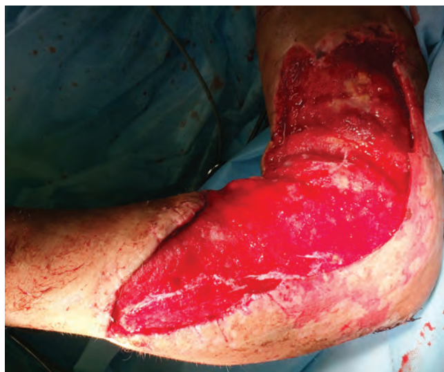
Рис. 8. Вид раны после повторной хирургической обработки, 7-е сутки вакуум-терапии

ны рост молодой грануляционной ткани, снижение отека мягких тканей, признаки жизнеспособности мышечного массива (рис. 8). По результатам контрольных микробиологических исследований роста микроорганизмов с поверхности раны и из подкожных карманов не обнаружено.