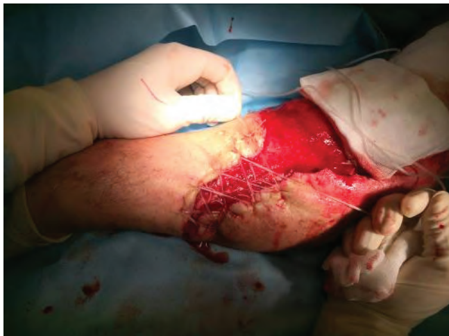
Рис. 9. Частичная пластика раны левой верхней конечности местными тканями методом дозированного тканевого растяжения

С целью местного антибактериального, анестетического эффектов и улучшения эвакуации раневого отделяемого, а также пролонгации экспозиции работы повязки VivanoMed® Foam Kit к системе добавлены 2 санационных порта с дозированным введением в повязку с заданной скоростью по перфузору многокомпонентного физиологического раствора (рингер), местного анестетика (наропин), антибактериального препарата (ванкомицин). Экспозиция вакуумной терапии на 2-м этапе лечения, учитывая снижение объема раневого отделяемого до 200,0 мл, подключение дополнительных санационных портов, применение атравматического раневого покрытия Atrauman® Ag составила 96 ч. Скорость поступления поликомпонентного раствора по перфузору в повязку составляла 6–10 мл/ч. Применение дополнительного введения комплекса анестетического, антибактериального и физиологического растворов улучшило переносимость NPWT больным и пролонгировало работу повязки.