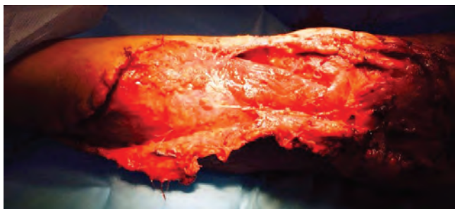
Рис. 2. Состояние мягких тканей после снятия лигатур

При поступлении в травматологическое отделение состояние мягких тканей пораженной конечности расценено как развивающийся компартмент-синдром на фоне открытого оскольчатого перелома средней трети левой плечевой кости и инфицированной ушитой обширной травматической раны левого плеча и предплечья. По срочным показаниям выполнена хирургическая обработка раны левой верхней конечности (рис. 2). Выполнено снятие лигатур с раны и ушитых фасциальных футляров, забор биоматериала для качественного и количественного микробиологического исследования, иссечение нежизнеспособных, разможенных тканей с последующей обработкой раневой поверхности «пульсирующей струей жидкости», стабилизация перелома интрамедуллярным блокированным штифтом без сверливания канала (рис. 3). На завершающем этапе данного хирургического вмешательства начата терапия отрицательным давлением (NPWT) с использованием