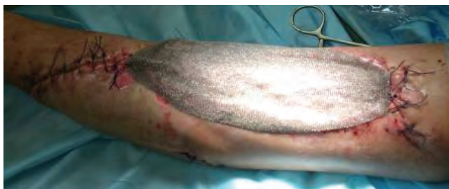
Рис. 13. Защита трансплантата атравматическим раневым покрытием Atrauman® Ag