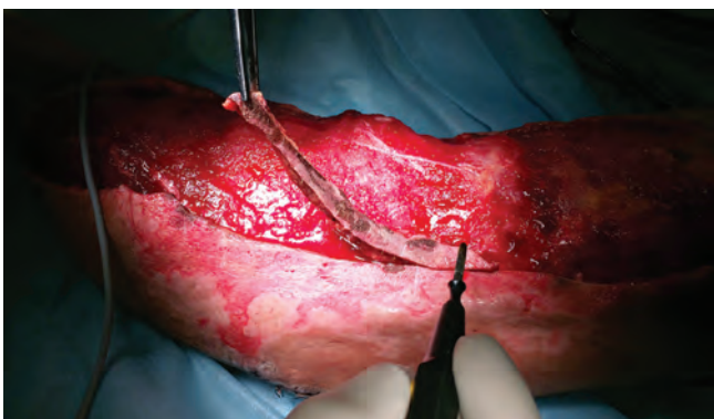
Рис. 6. Экономное иссечение нежизнеспособных тканей

Через 2 сут после хирургической обработки в условиях операционной под сочетанной анестезией вакуумная повязка снята, адаптационные эластические «шнурочные» швы удалены, выполнена ревизия подкожных карманов (рис. 4, 5). Произведен забор раневого отделяемого с целью динамического микробиологического мониторинга. При ревизии раны и подкожных карманов выявлены краевые некрозы отслоенной кожи от 0,5 до 1,5 см на протяжении 10,0 см. Выполнено экономное иссечение нежизнеспособных тканей (рис. 6). На заключительном этапе операции произведена обработка раны пульсирующей струей жидкости (рис. 7).