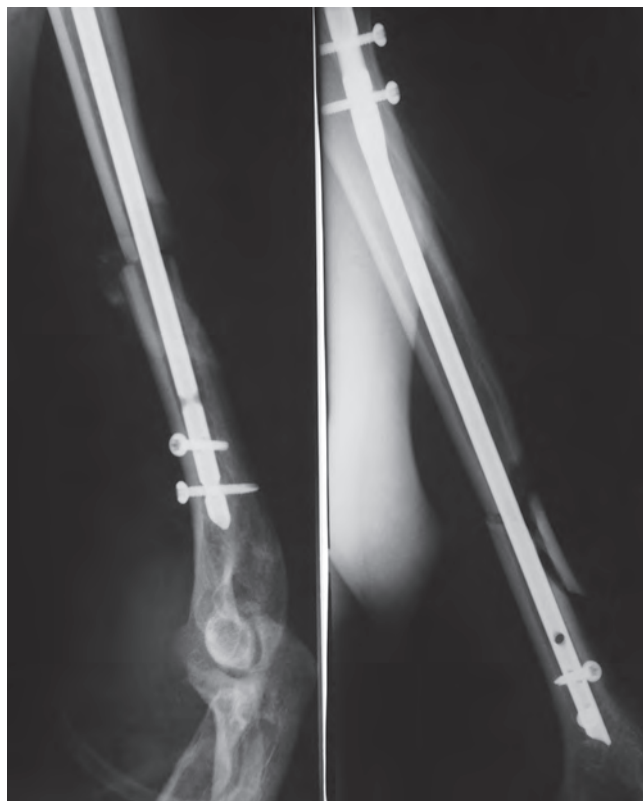
Рис. 3. Интрамедуллярный остеосинтез левой плечевой кости после репозиции

стерильных одноразовых наборов VivanoMed® Foam Kit (L) в постоянном режиме 120 мм рт. ст., аппаратом S 042 NPWT/Vivano Tec®.